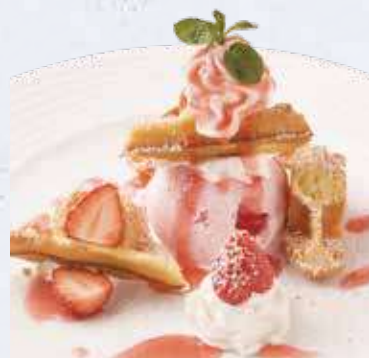
季節のワッフル 700円(税込770円)