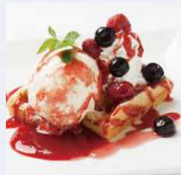
ミックスベリーワッフル 680円(税込748円)