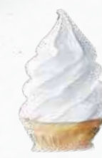
ソフトクリーム (バニラ) 330円(税込363円)