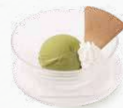
本日のアイス 300円(税込330円)