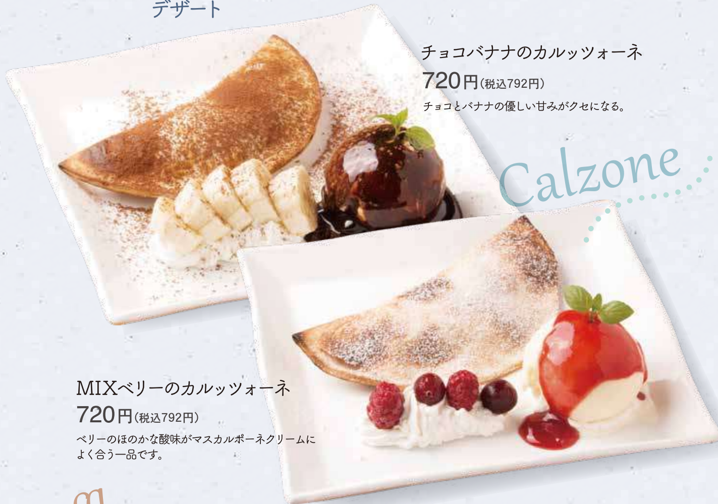
チョコバナナのカルッツォーネ 720円(税込792円) チョコとバナナの優しい甘みがクセになる。