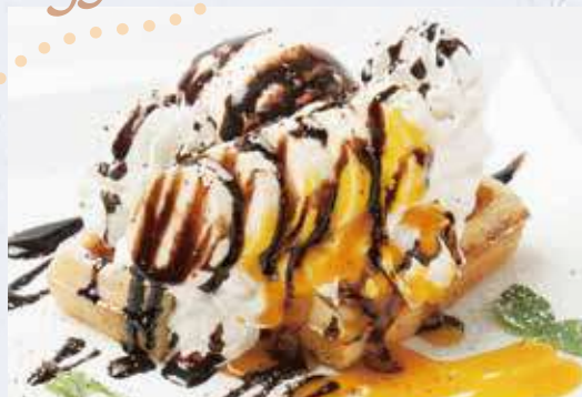
チョコバナナワッフル 680円(税込748円)